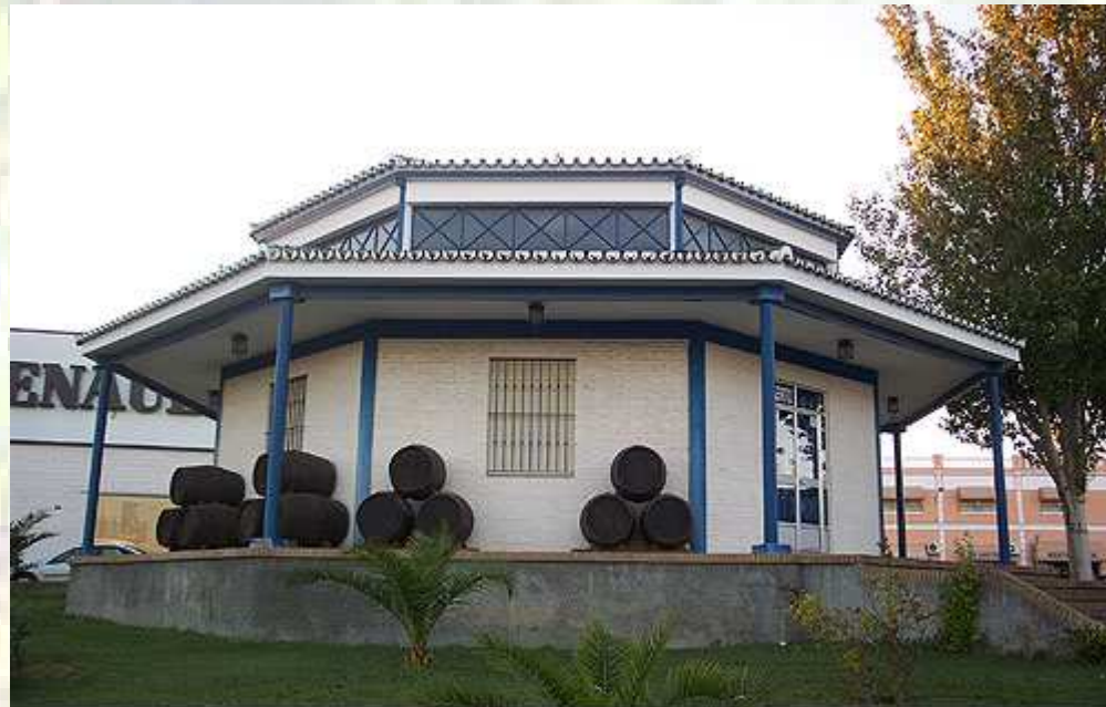
Casa del vino